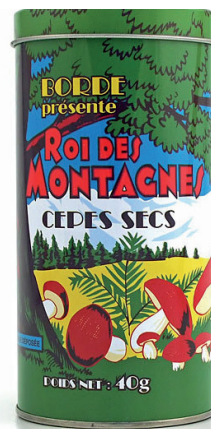
Cèpes extra séchés en boite fer - 6.10€