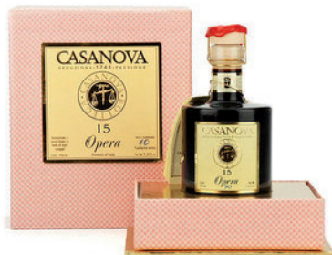
Coffret vinaigre balsamique 15 ans Opera - 46.80€