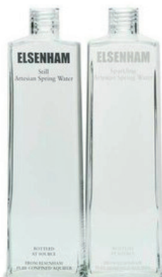
Elsenham Eau d'Angleterre Bouteille en verre Dès 10.05€