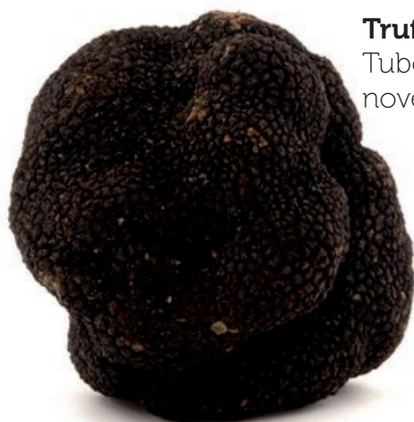
Truffe noire fraîche de Lozère - Tuber melanosporum. A partir de novembre sur BienManger.com