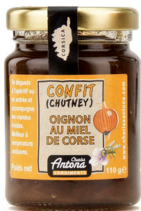
Chutney d'oignons au miel de Corse - 3.45€