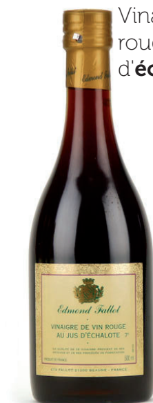
Vinaigre de vin rouge au jus d'échalote - 4.35€