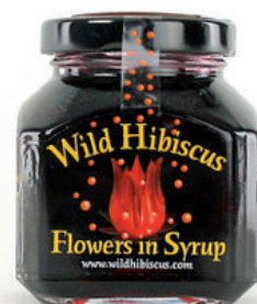
Fleurs d'hibiscus au sirop Wild Hibiscus Dès 15.50€