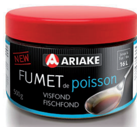
Fumet de poisson en pâte - 15.95€