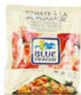
Sauce wok à la sichuannaise