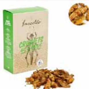
Criquets ail et basilic thaï