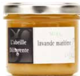
Miel de lavande maritime