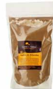
Poudre de caroube portugaise