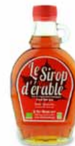
Sirop d'érable bio