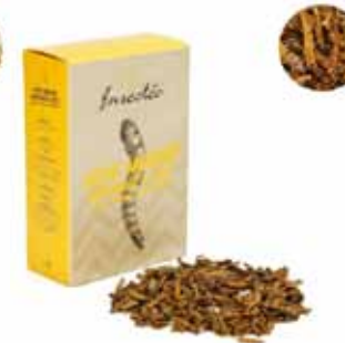
Vers géants moutarde et miel