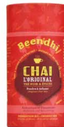
Thé chaï bio original