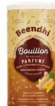
Bouillon bio parfumé gingembre et curcuma