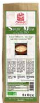
Soupe Miso instantanée bio