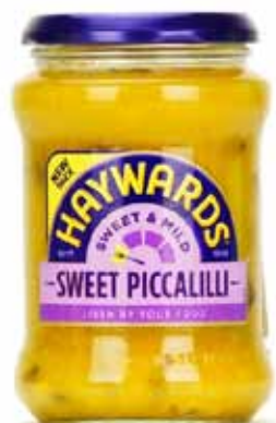
Sauce Piccalli Hayward's