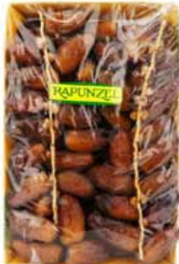
Dattes Deglet Nour en ravier bio