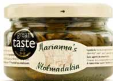
Feuilles de vignes farcies bio