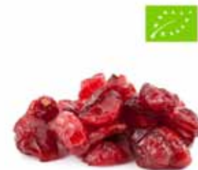
Cranberries séchées et sucrées bio