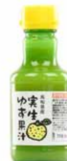
Jus de yuzu sauvage