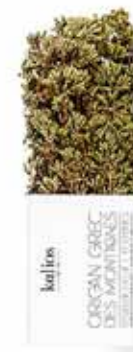
Origan en branche de Grèce