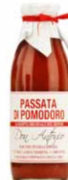
Passata di Pomodoro