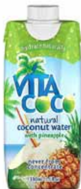
Eau de coco ananas