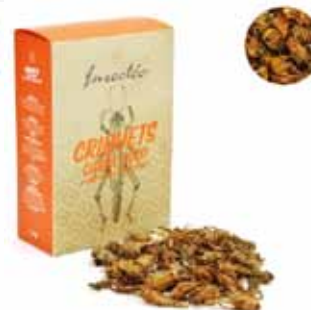
Criquets coco et curry