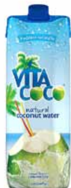
Eau de coco nature