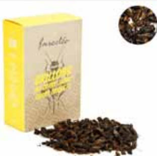
Grillons au curry jaune