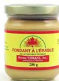
Fondant d'érable bio du Canada