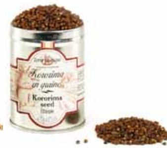
Graine de Paradis, Kororima, Ethiopie