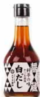
Bouillon dashi blanc concentré