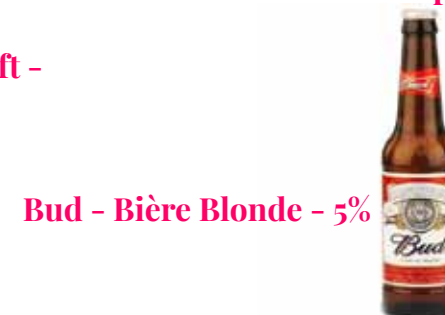
Bud - Bière Blonde - 5%