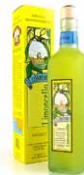
Limoncello di Sorrento