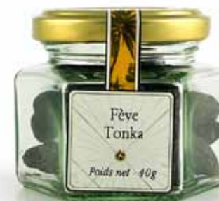
Fève de Tonka entière