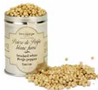
Poivre blanc de Penja fumé