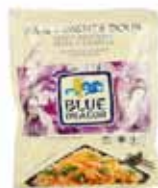
Sauce wok ail et piment doux