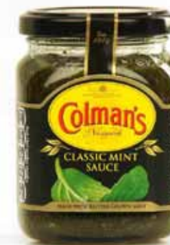
Sauce à la menthe