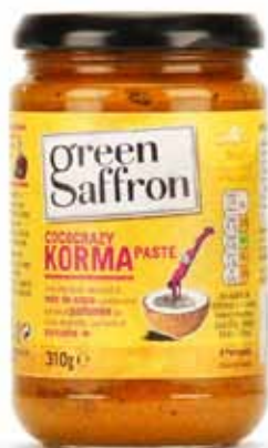
Pâte concentrée pour sauce Korma