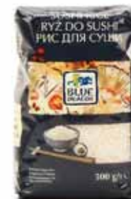
Riz spécial sushi