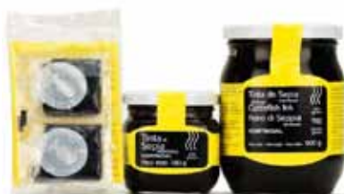
Encre de seiche au naturel