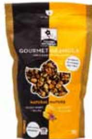
Granola Gourmet au miel et à la maca