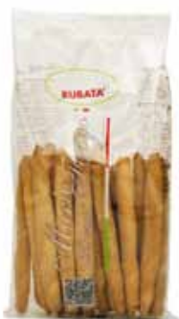
Mini gressin rubata nature