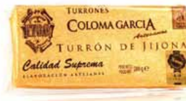
Turrón aux amandes Marcona