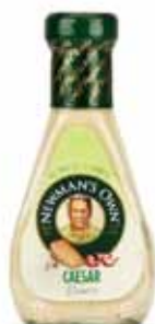
Sauce salade Caesar