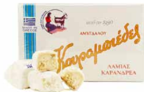
Kourabiedes aux amandes