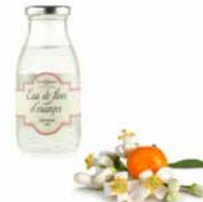
Eau de fleur d'oranger