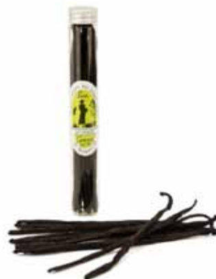
Vanille Bourbon gousse - Madagascar