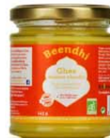
Ghee bio beurre clarifié