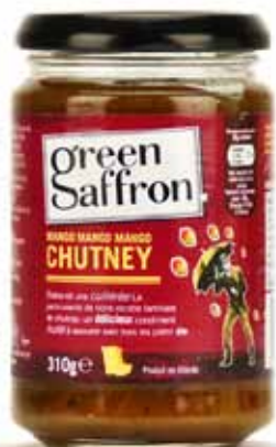
Chutney de mangues