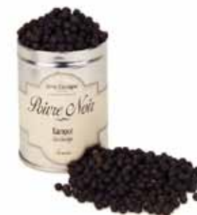
Poivre noir de Kampot