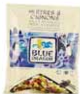
Sauce wok huîtres & oignons