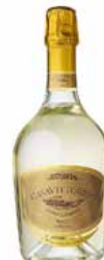
Prosecco Bru Casa Vittorino DOGG