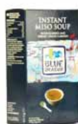
Soupe miso avec garniture