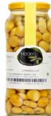
Tremoço - graines de lupin apéritives