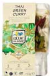
Sauce au curry vert thaï en 3 étapes