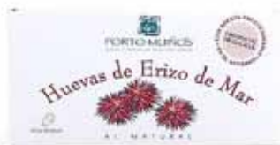
Corail d'oursin de mer