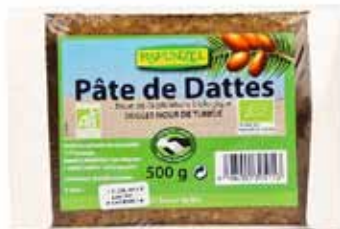
Pâte de dattes bio de Tunisie