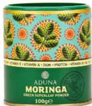
Poudre de Moringa