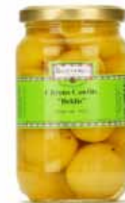
Citrons confits Beldi