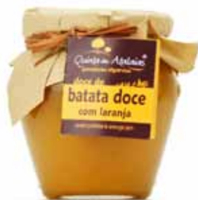
Confiture portugaise de patate douce et orange