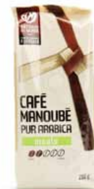
Café Manoubé pur arabica moulu