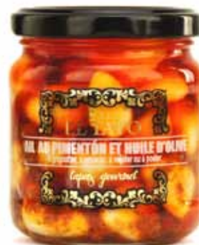
Dents d'ail aux herbes piquantes, vinaigre et huile d'olive