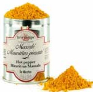
Massalé pimenté Ile Maurice