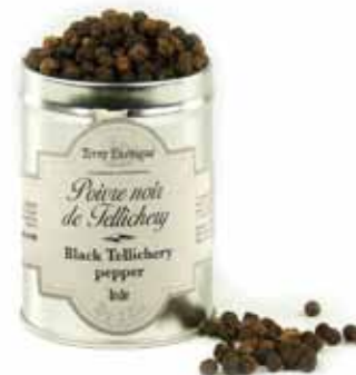
Poivre noir de Tellicherry