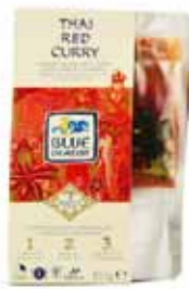
Sauce au curry rouge thaï en 3 étapes