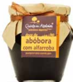
Confiture portugaise de citrouille et caroube