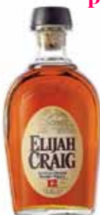
Elijah Craig 12 ans straight bourbon du Kentucky - 47%