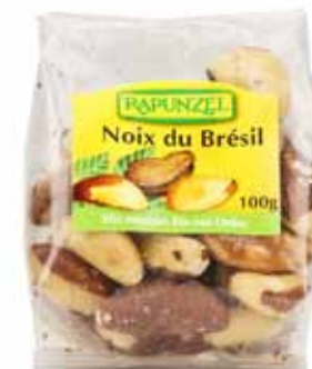
Noix du Brésil bio