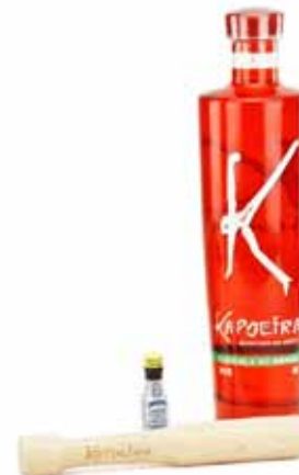
Cachaça Kapoeira - 38%