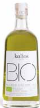
Huile d'olive vierge extra bio