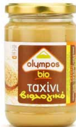
Tahini grec purée de sésame