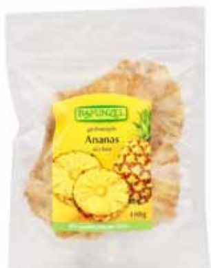
Rondelles d'ananas séchées bio Togo