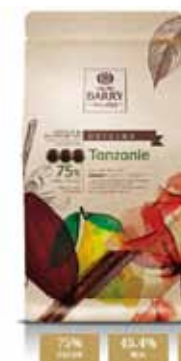
Chocolat de couverture Tanzanie- 75%