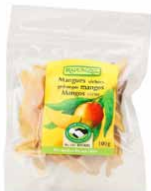
Mangues séchées en lamelles bio Burkina