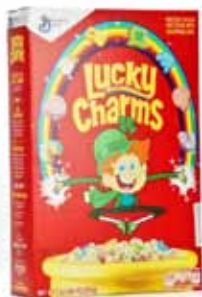
Céréales Lucky Charms