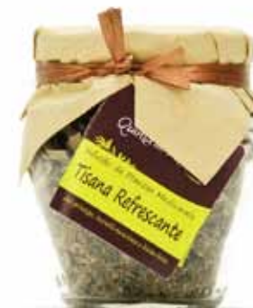
Infusion bio rafraîchissante