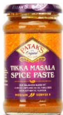
Sauce Tikka Masala