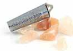
Diamant de sel de l'Himalaya et sa râpe