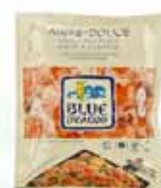
Sauce wok aigre douce