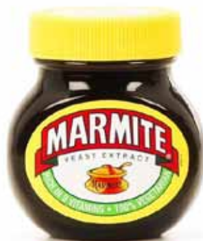
Marmite Yeast Extract