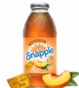
Thé glacé à la pêche