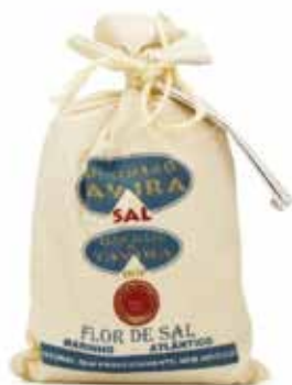
Fleur de sel ultra pure de l'Atlantique