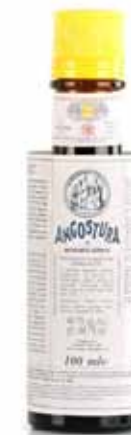
Angostura Aromatic Bitters