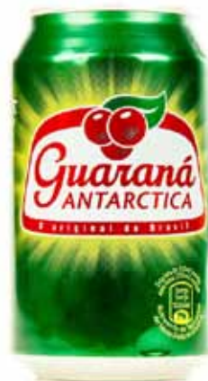
Soda au guarana