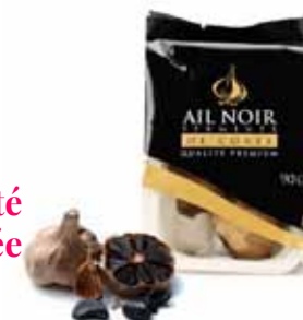
Ail noir fermenté de Corée