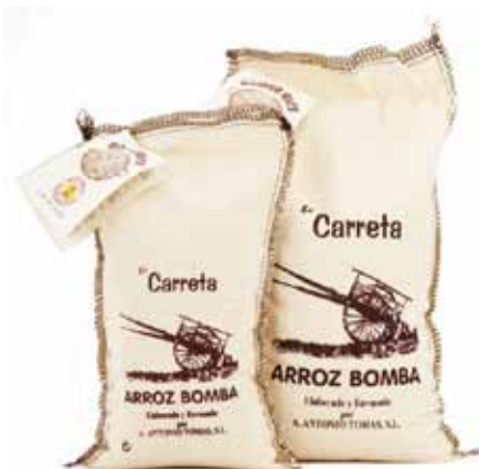
Riz extra bomba AOP Valencia