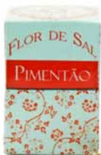
Fleur de sel au poivron