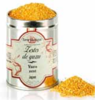
Zestes de yuzu