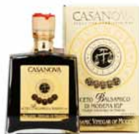
Vinaigre balsamique Casanova