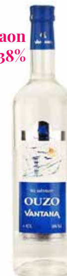
Ouzo Aenaon 38%