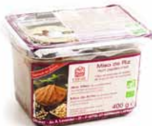
Miso de riz non pasteurisé bio