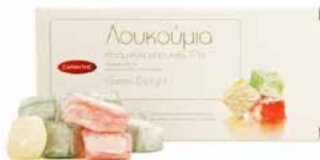
Loukoums grecs mélange d'arômes