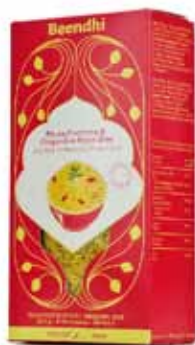
Riz bio au curcuma et gingembre façon Goa