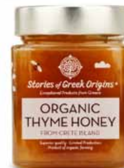
Miel de thym bio de Crète