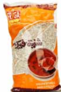
Semoule d'orge « Frik »