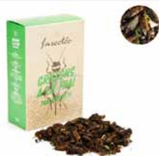
Grillons à la thaï