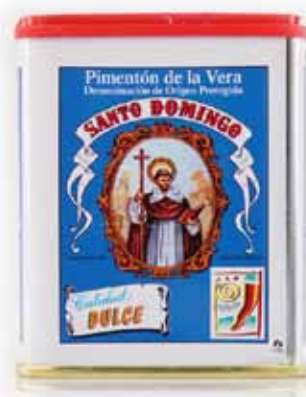
Paprika doux traditionnel