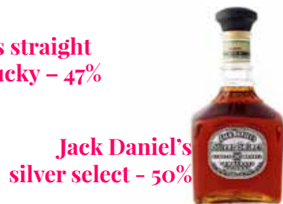
Jack Daniel's silver select - 50%