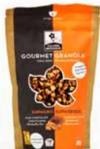
Granola gourmet Euphorique