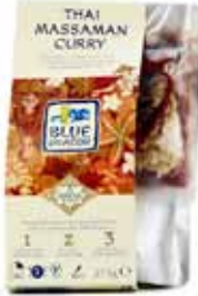
Curry massaman thaï en 3 étapes