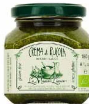
Crème de roquette bio