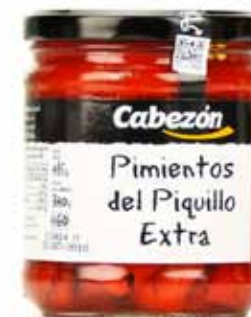
Pimientos del piquillo entiers extra