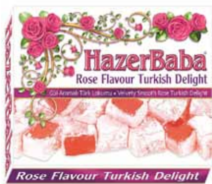
Loukoums à la rose