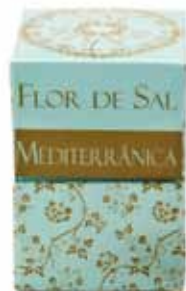
Fleur de sel mélange méditerranéen