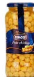
Pois chiches trempés