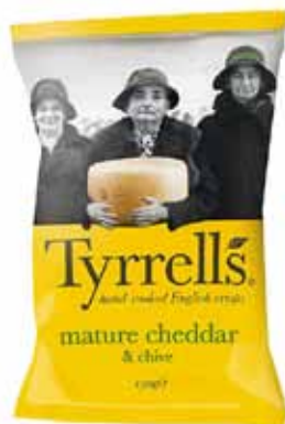
Chips de pommes de terre au cheddar affiné et à la ciboulette