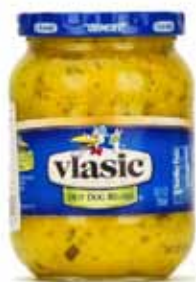
Sauce relish pour hot-dogs