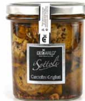
Petits artichauts grillés à l'huile d'olive