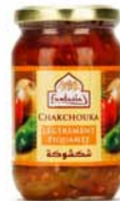
Chakchouka légèrement piquante