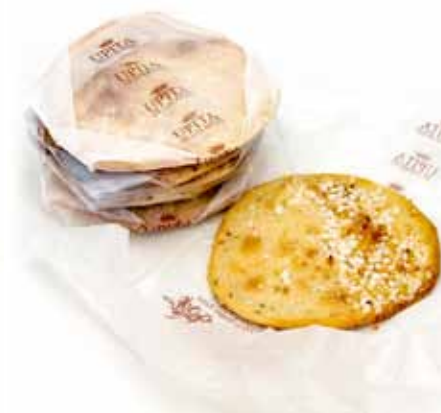
Tortas especial Almendra