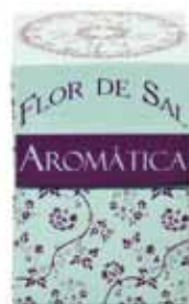
Fleur de sel mélange aromatique