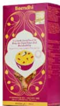
Curry de lentilles bio façon Pondichéry