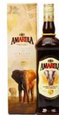
Amarula liqueur de Marula 17%