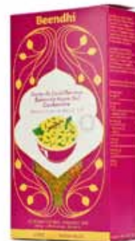
Curry de lentilles façon Dal Cachemire