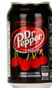
Dr Pepper à la cerise