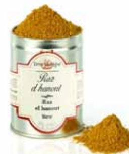
Raz el Hanout Maroc