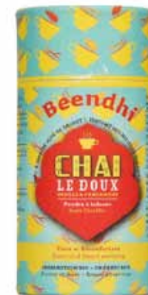
Thé chaï doux bio vanille et cardamome