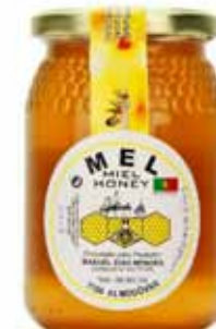
Miel de fleur d'orange du Portugal