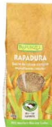
Rapadura, sucre de canne complet bio