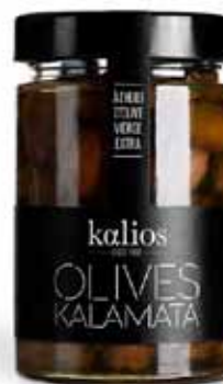
Olives de Kalamata de Grèce AOP