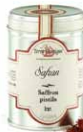
Safran de Kashmar Iran