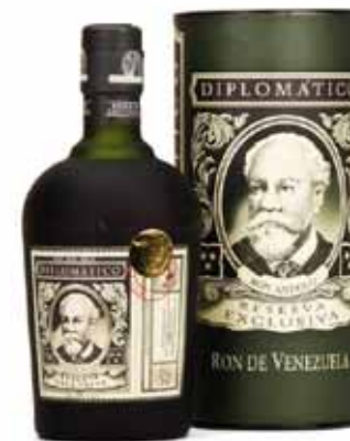
Rhum Diplomatico 40%